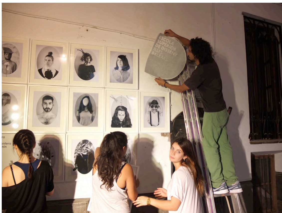
Gerhardt Braun Gallery Palma de Mallorca 2013

Partiendo de la exploración del trabajo de la artista polaca los alumnos realizaron unos autoretratos que se expusieron en el marco de Festival Palmaphoto y en una galería de arte de la ciudad.