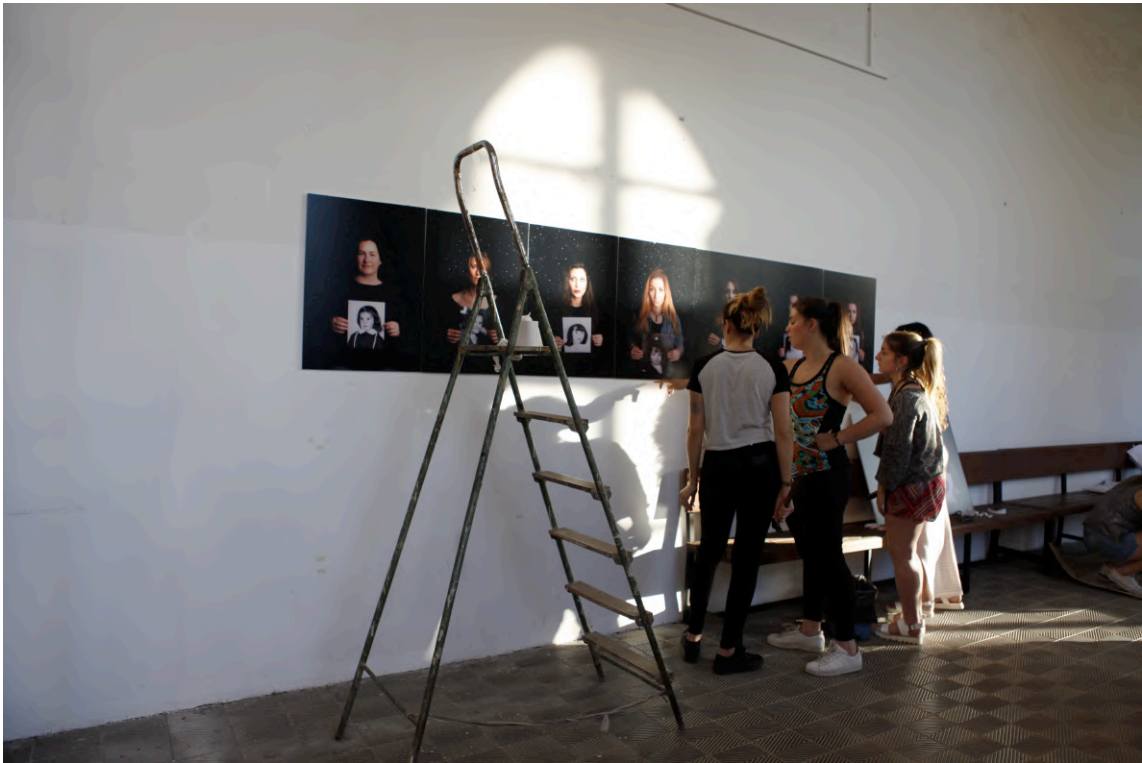
Palma de Mallorca, 2015