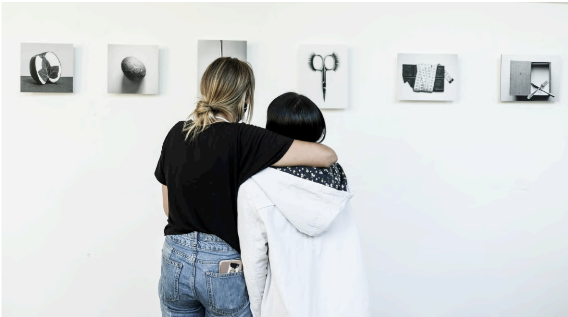
Escuela Superior de Diseño de Palma de Mallorca 2021